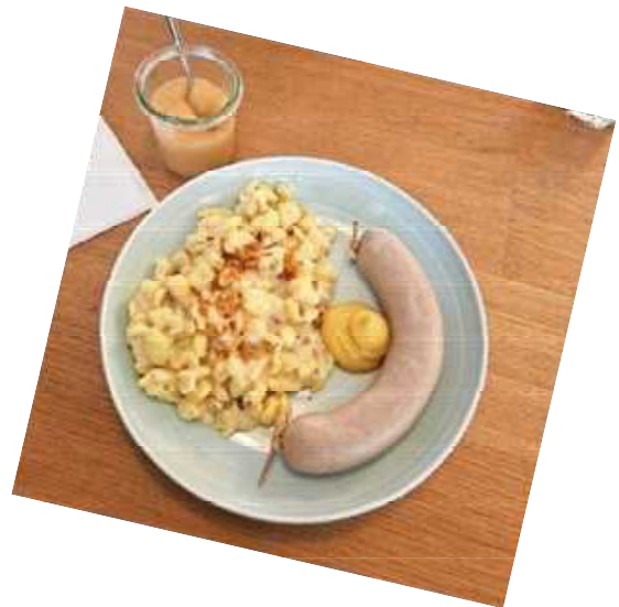
Variante mit Chäschnöpfli