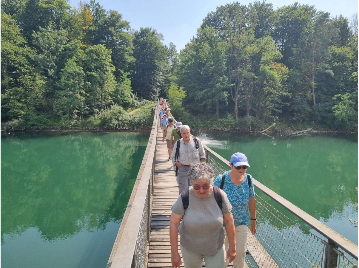
Weiter über die Hängebrücke.