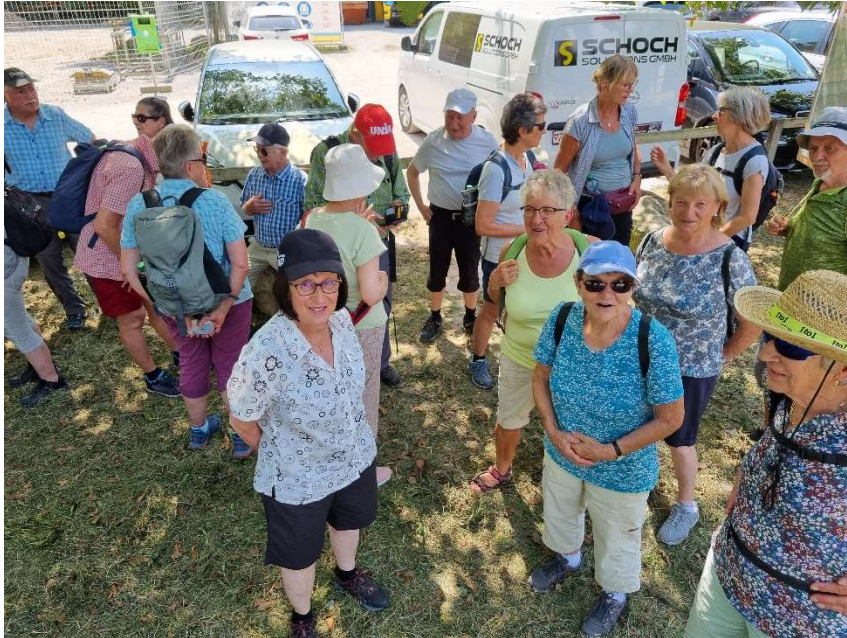
Beim Treffpunkt in Rapperswil

24 fuhren mit 6 Autos nach Rapperswil, 4 hatten sich entschieden mit der Bahn anzureisen.