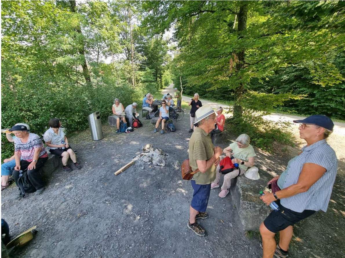
Pause um zu trinken. Temperatur war über 30 Grad.