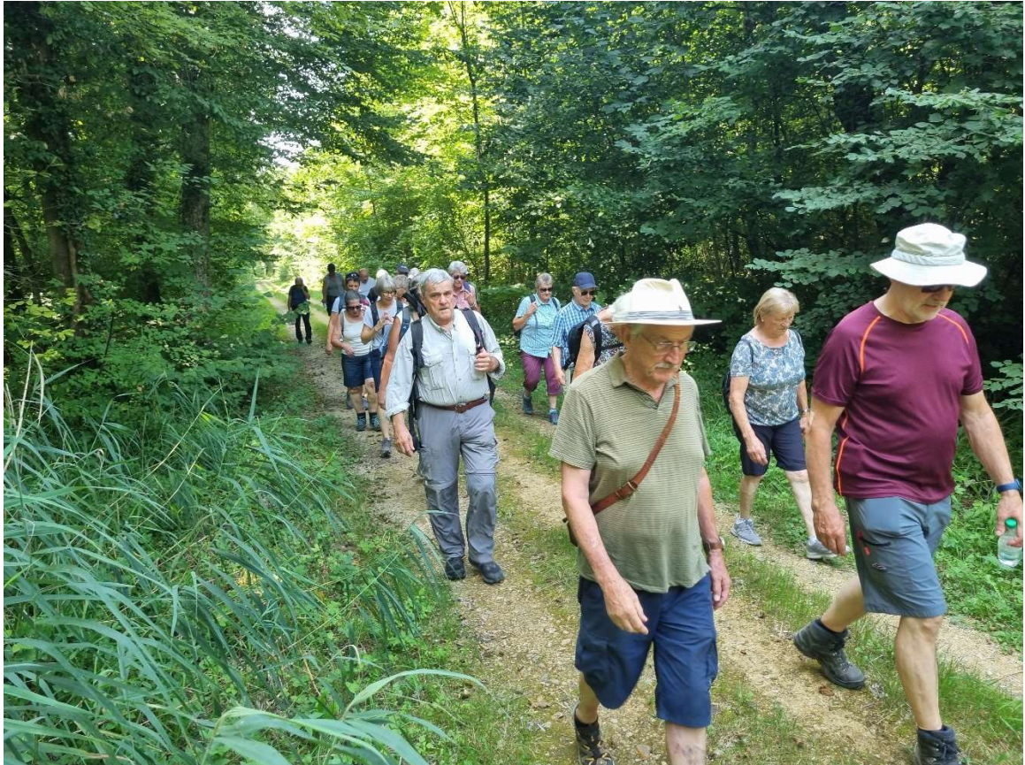
Wanderung vorwiegend durch schattigen Wald und der Aare entlang.