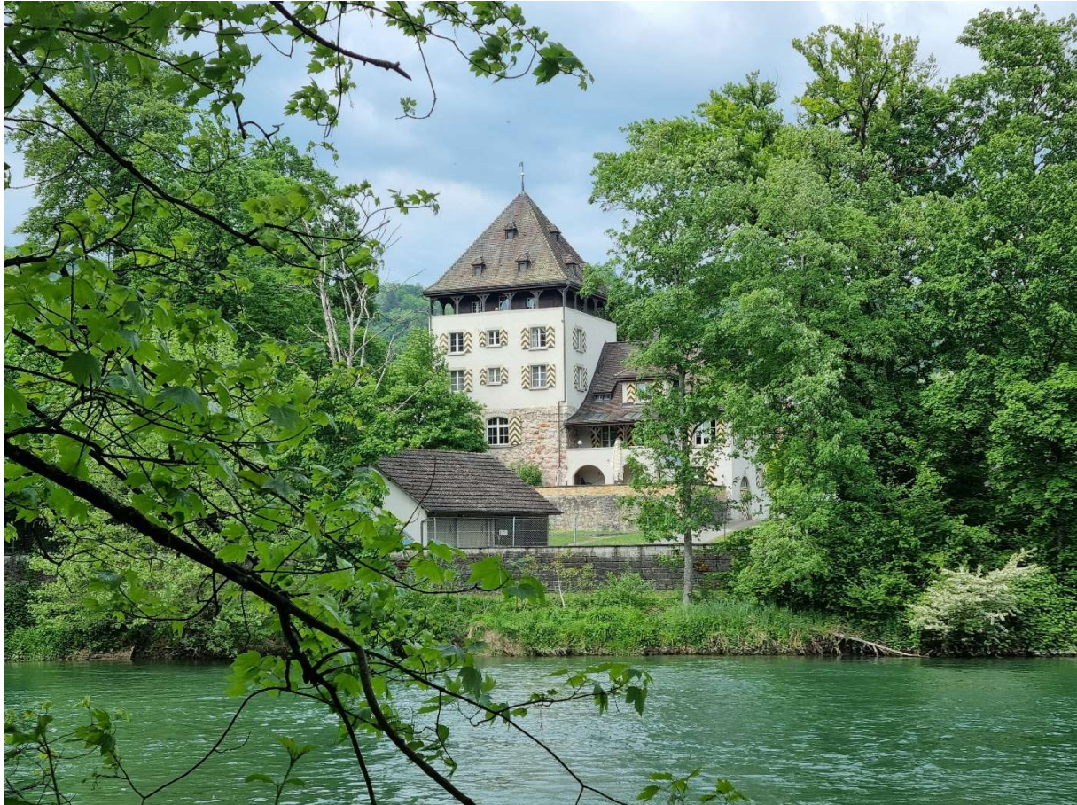
Blick auf Schloss Auenstein.