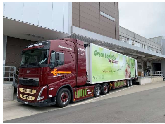
Lastwagen mit Elektroantrieb sind auch bereits täglich unterwegs.