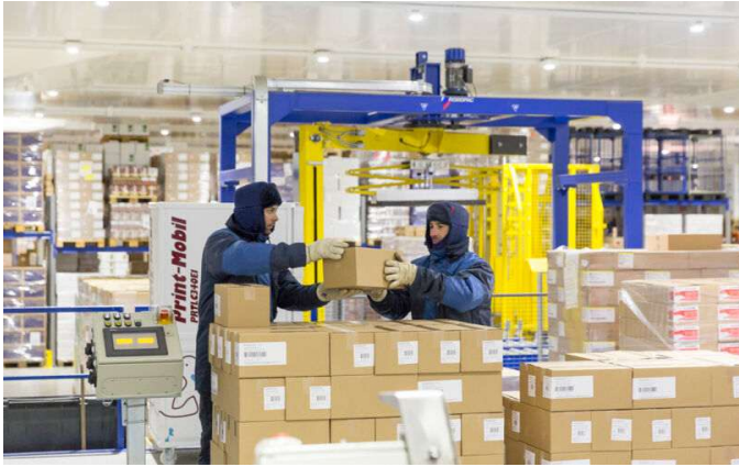
Tiefkühlprodukte werden bei -25 Grad gelagert.