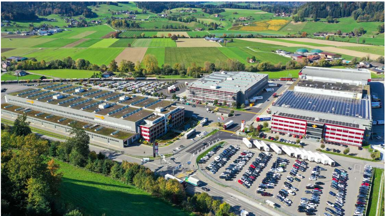
Bericht und Fotos: Hanspeter Pizzolato