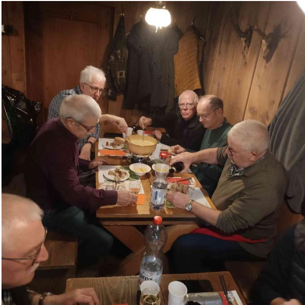
Das Fondue, vorbereitet von der Käserei Aarwangen, mundete herrlich und ist mit diversen Beilagen (in welcher Konsistenz auch immer 😊) veredelt worden.