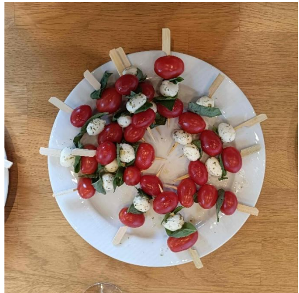
Apéro-Spiessli und Birebrot-Chäs-Häppli