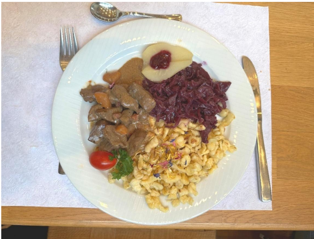
Hauptgang: Rindgulasch an Balsamico-Portweinsauce Rotchabis nach Grossmueterart