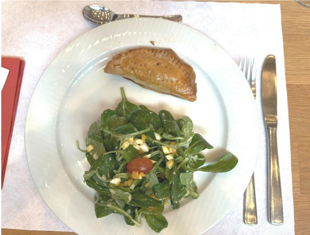
Vorspeise: Käse-Hackfleisch Karpfen mit Nüsslisalat