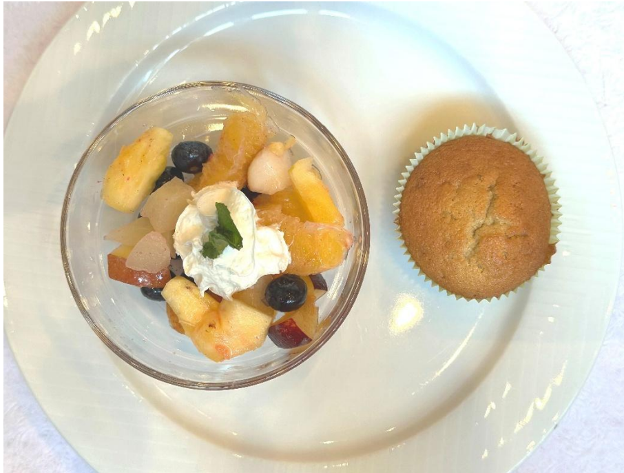
Zwetschgenmuffin und Fruchtsalat

Zum Dessert: Wie könnte es anders sein, ganz einfach vortrefflich