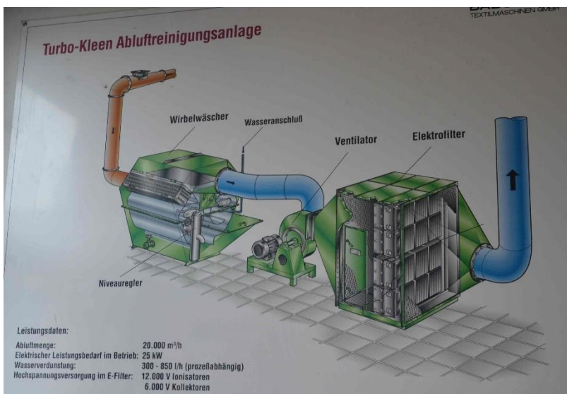
Systematik der Abluft-Reinigungsanlage