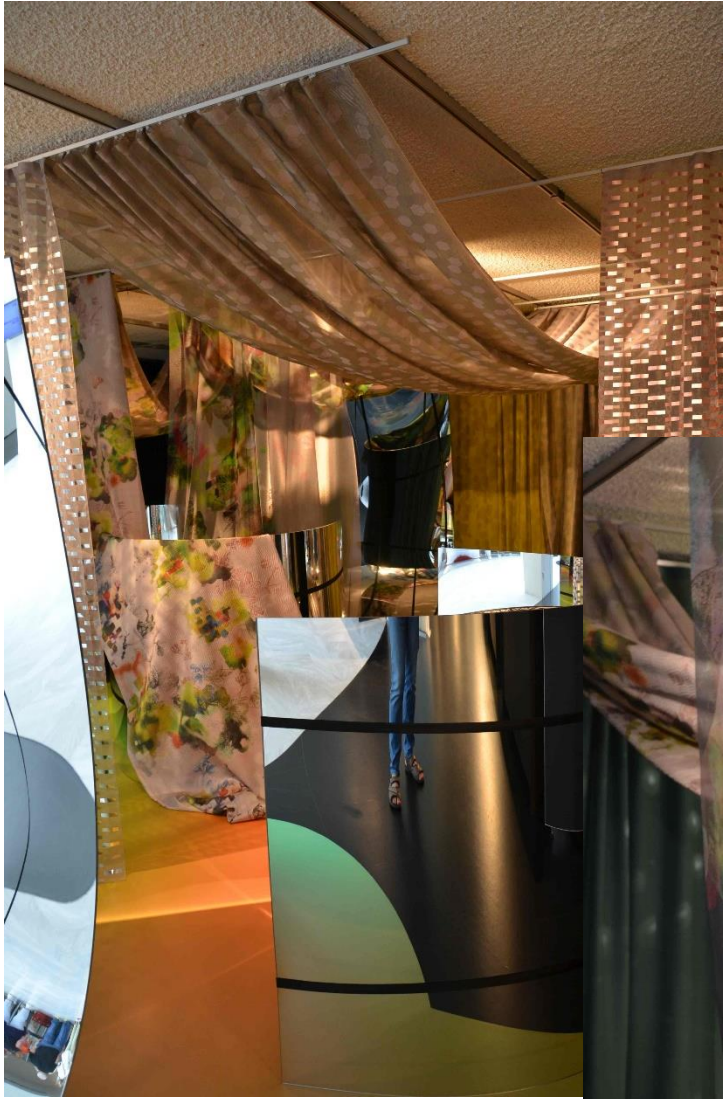
Eindrücke aus dem Ausstellungsraum