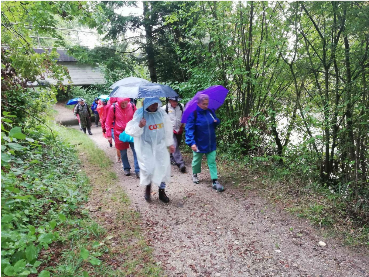
Der Regen begleitete uns, mal mehr mal weniger intensiv, auf dem ganzen Weg bis zum Schloss Landshut.